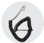
PISTOLA SANISPRAY CON TUBO SPIRALATO LUNGHEZZA 12m SANISPRAY GUN WITH SPIRAL HOSE LENGHT 12m