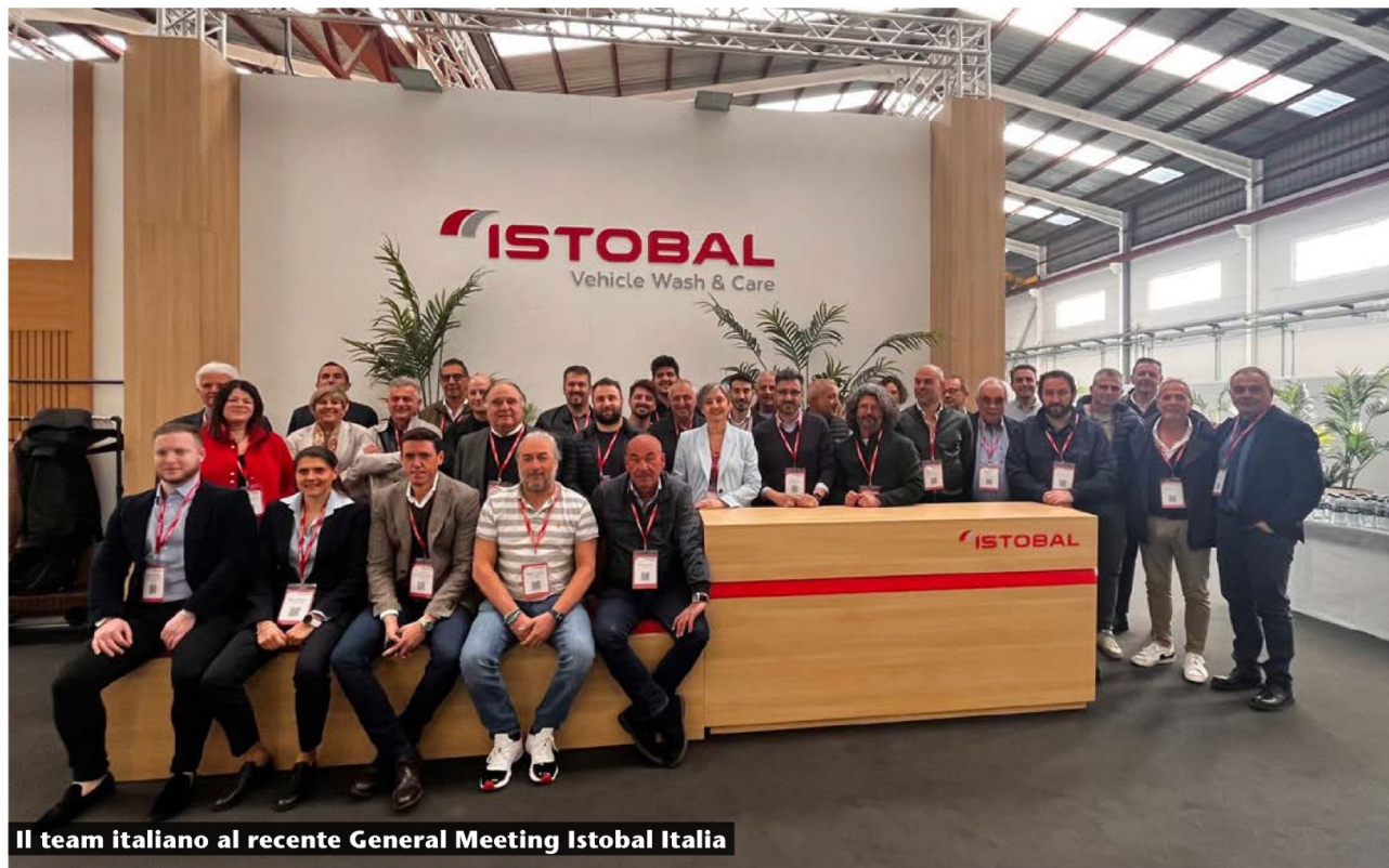
Il team italiano al recente General Meeting Istobal Italia

L'Italia è da sempre uno dei mercati principali per il gruppo Istobal e con