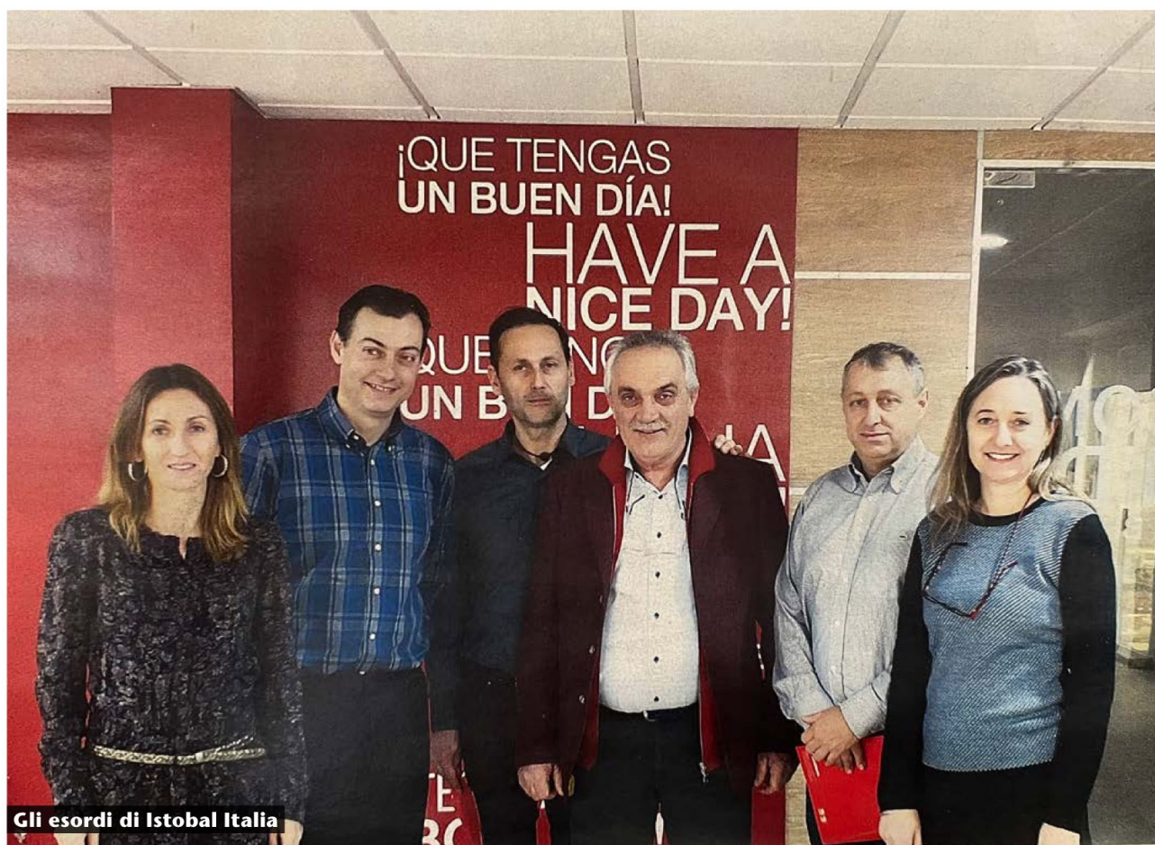
Gli esordi di Istobal Italia

Già nel 2019 Istobal Italia ha iniziato ad operare ufficialmente come filiale commerciale distributiva, creando in alcune zone un proprio servizio tecnico ufficiale. Con questo ambizioso progetto, l'azienda non solo ha raggiunto quelle aree italiane prive di distributori, per poi proporre la sua vasta gamma di prodotti a tutto il territorio nazionale, ma ha anche incrementato le vendite rafforzando ulteriormente la propria presenza in Italia come in Europa. Infatti, la nascita di Istobal Italia è stata una pietra miliare nel piano strategico di espansione della multinazionale spagnola, che vanta già più di 70 anni di